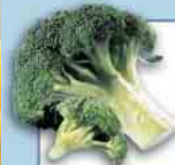
Broccoli + 13 Tage