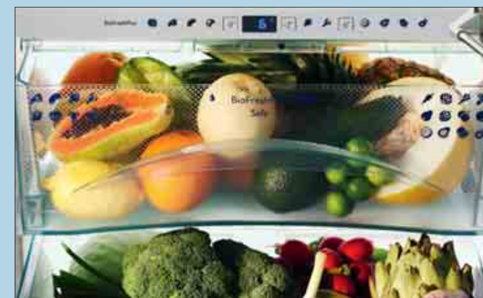
Die drei großzügigen BioFresh-Schubfächer laufen komfortabel auf Teleskop-schienen. Das oberste Fach ist als BioFreshPlus individuell regelbar.

Die neue Side-by-Side-Kombination SBSes 7273 überzeugt mit vier Klimazonen. Für das tägliche Frische-Vergnügen steht ein großzügiges Kühlteil zur Verfügung. Obst, Gemüse, Fleisch und Milchprodukte bleiben im BioFresh-Fach bis zu dreimal länger frisch. Die neue BioFreshPlus-Technologie bietet noch mehr Flexibilität für die individuelle Vorratshaltung. In der Trennplatte zwischen Kühl- und Gefrierfach ist eine elektronische Steuerung integriert: Mit dieser kann beispielsweise für die Lagerung von Fisch die Temperatur im oberen Fach auf -2\text{ }^{\circ}\text{C} abgesenkt werden. Zusammen mit der Einstellung DrySafe bleibt Fisch so noch länger frisch. Südfrüchte können im Hyrosafe bei +6\text{ }^{\circ}\text{C} ideal gelagert werden. Bei Bedienung der neuen Funktionen wird jeweils das obere BioFresh-Fach auf die gewünschte Temperatur eingestellt. Das untere Fach kann bei 0\text{ }^{\circ}\text{C} individuell als Hydro- oder DrySafe genutzt werden.