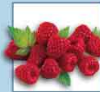
Himbeeren Lagerdauer + 3 Tage