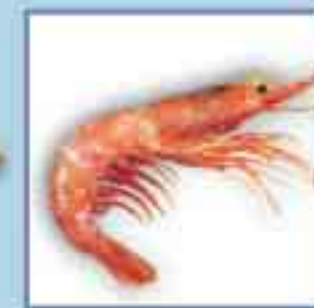
Scampi + 4 Tage (bei -2 Grad)