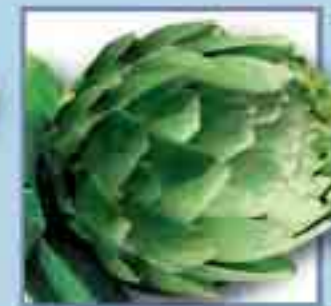
Artischocke + 14 Tage