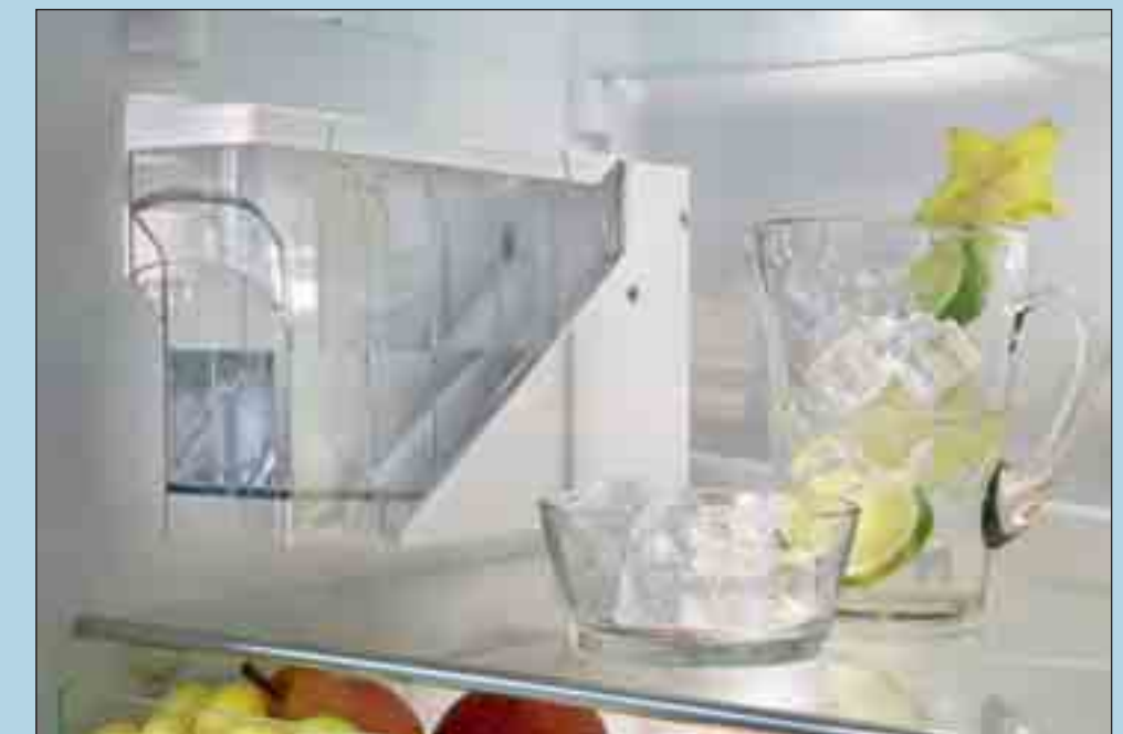
Ein Wassertank im Kühlteil hält 1,5 Liter Trinkwasser zur Eiswürfelproduktion bereit.

Je nach Gerät erhalten Sie den vollautomatischen IceMaker mit Festwasseranschluss oder mit Wassertank. Mit einer Füllmenge von 1,5 Litern ist die Eiswürfel-Produktion für 36 Stunden gesichert.