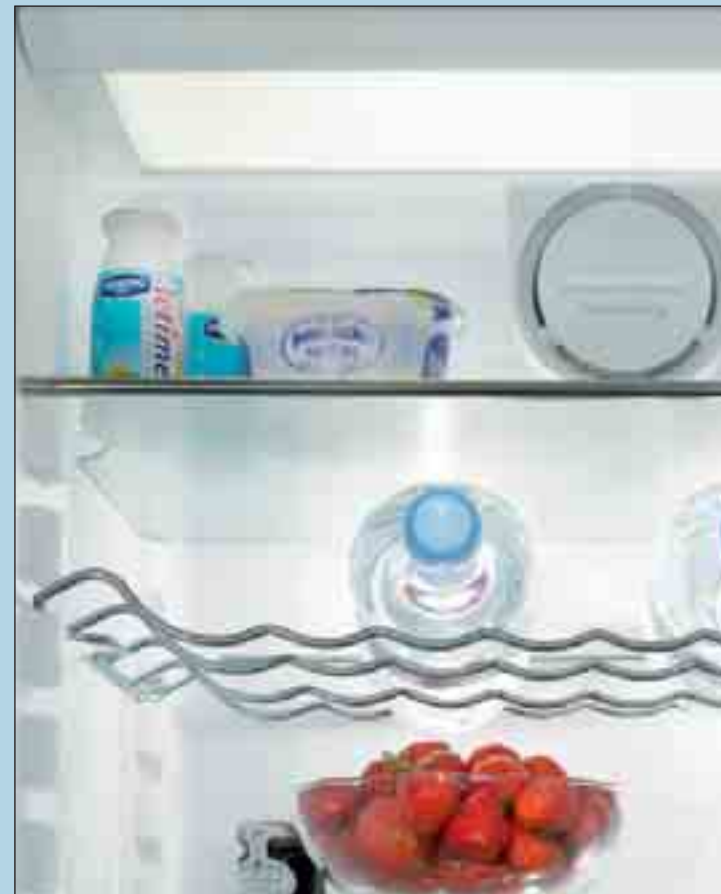
Kennzeichnend für die Premium-Deckenbeleuchtung ist eine flächige Beleuchtung integriert in der Decke. Durch eine speziell satinierter Glasplatte abgedeckt wird eine angenehme Rundum-Beleuchtung des Kühlraumes gewährleistet.