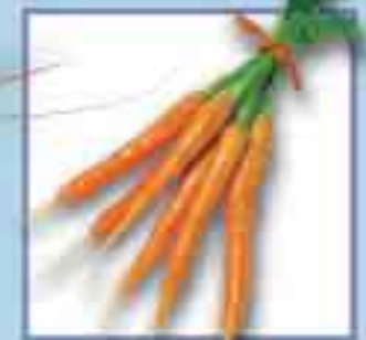
Karotten +80 Tage