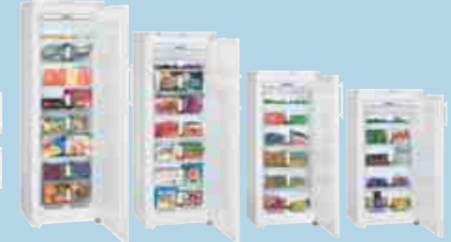
GN 3056 Premium GN 2756 Premium GN 2356 Premium GN 1956 Premium