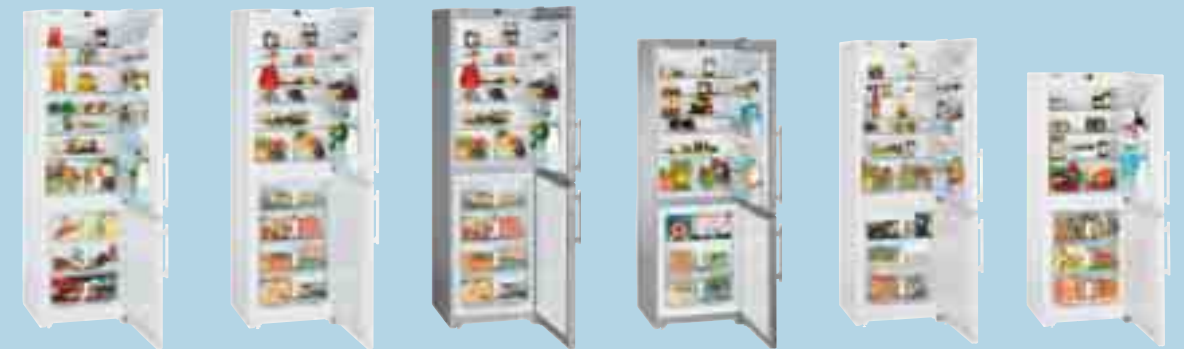
CUN 4013 Comfort CUN 3913 Comfort CUNesf 3913 Comfort CUNesf 3513 Comfort CUN 3513 Comfort CUN 3113 Comfort