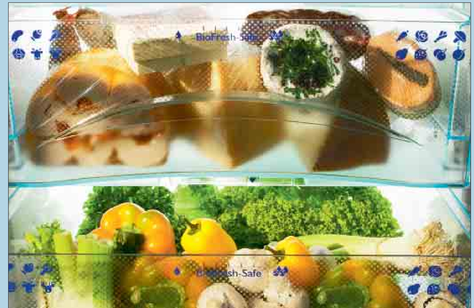
BioFresh von Liebherr – die komfortable Lösung für dreifach lange Frische.

bleiben die wertvollen Vitamine, das delikate Aussehen und der frische Geschmack bis zu dreimal so lange erhalten wie im normalen Kühlteil. Im erfolgreichen Liebherr-BioFresh-Programm finden Sie das passende Gerät für jeden Bedarf.