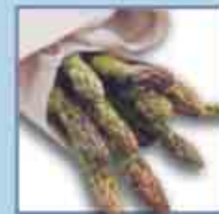
Spargel + 18 Tage

Für Fitness und Wohlbefinden empfehlen Ernährungswissenschaftler ein einfaches Power-Rezept: gesund essen. Denn die Natur bietet ein komplettes Spektrum an Vitalstoffen: Vitamine, Mineralien und Kohlehydrate schenken Energie, Ausdauer und obendrein noch gute Laune. Aber nur in der richtigen Temperatur und der idealen Luftfeuchtigkeit behalten Lebensmittel ihren Gesundheitswert und den feinen Geschmack so lange wie möglich. Die BioFresh-Technologie von Liebherr bringt deshalb mit superlanger Haltbarkeit das entscheidende Plus an Lebensqualität.