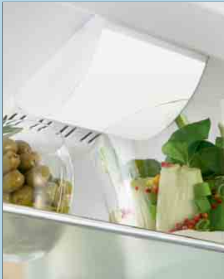
Die Comfort-Deckenbeleuchtung erzeugt durch eine spezielle Satinierung des Lichtgehäuses eine angenehme Lichtstimmung im kompletten Kühlraum.

beidseitig im Behälter integrierten LED-Lichtsäulen, die eine gleichmäßige Ausleuchtung des Kühlraums gewährleisten. Die spezielle Satinierung der Lichtabdeckung erzeugt eine angenehme, hochklassige Lichtstimmung. Gleichzeitig ermöglichen die Lichtsäulen eine variable Verstellung der Glasplatten.