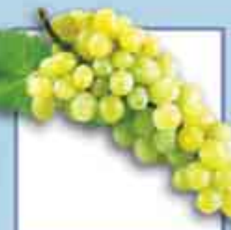
Weintrauben + 29 Tage

Diese Angaben beziehen sich auf die Lagerung im BioFresh-Fach im Vergleich zum herkömmlichen Kühlfach