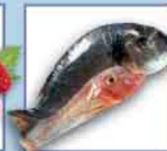
Fisch + 4 Tage (bei -2 Grad)