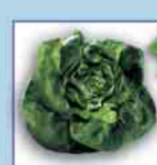
Kopfsalat + 10 Tage