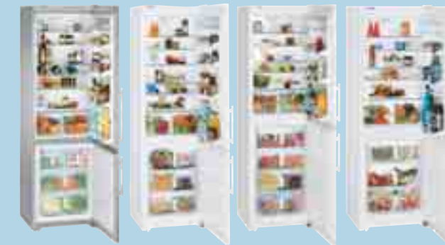
CNes 4066 Premium CN 4056 Premium CN 3956 Premium CN 3556 Premium