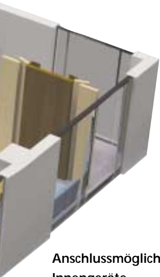
Anschlussmöglichkeit verschiedener Innengeräte