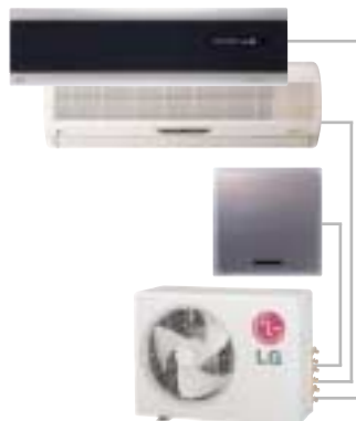
TRIO 1 - 3 Inneneinheiten