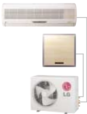
DUO 1 - 2 Inneneinheiten

Da an einer Ausseneinheit verschiedene Inneneinheiten angeschlossen werden können, sind die Systeme extrem flexibel.