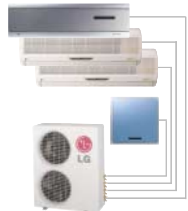
QUARTET 1 - 4 Inneneinheiten