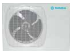
GRFP 255/365 L/R