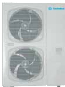
GRFP 485 L/R