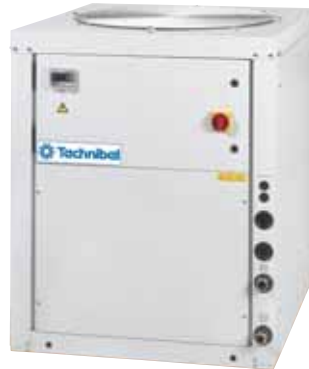
PHRV 22 bis 36

10 12 162 PHRV 22/40 10 12 168 PHRV 44/72