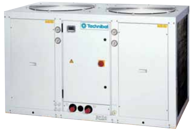
PHRV 44 bis 72