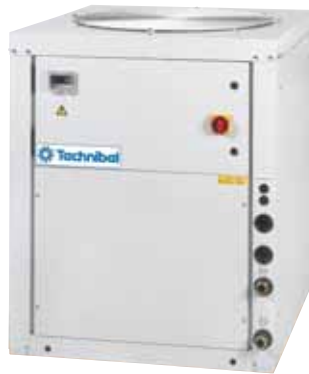
CHGV 22 bis 40

10 12 161 CHGV 22/40 10 12 167 CHGV 50/80