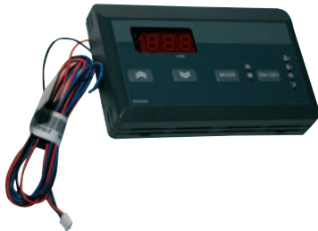
Fernbedienung PHR - PHRT