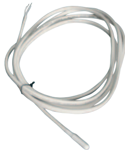
Bausatz Heizwiderstand Kondensatbehälter