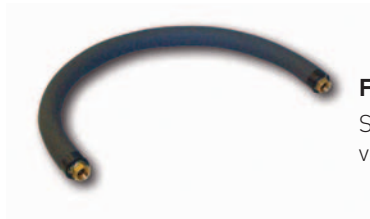
Flexiblen Wasseranschlußschläuchen für PHR-PHRT

Sie sind unerlässlich, um die Übertragung von Strukturgeräuschen zu vermeiden (Vibrationen des Kompressors und der Umwälzpumpe)..